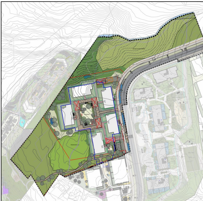
Utredningsalternativ – alt. 2