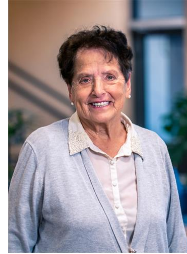
Tilhørighet og fellesskap