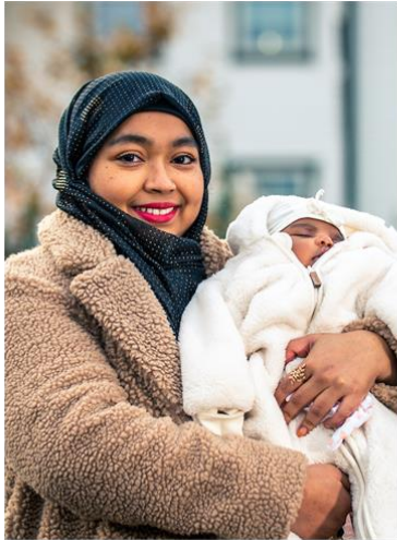
Bokvalitet og inkluderende bomiljø