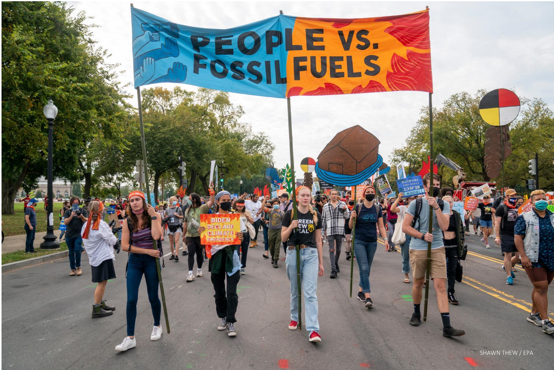
SHAWN THEW / EPA