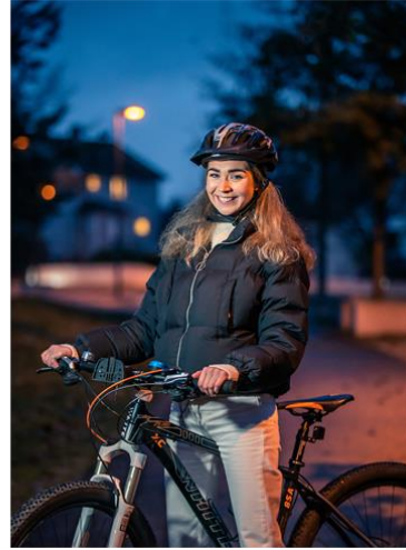
Trygg og miljøvennlig transport