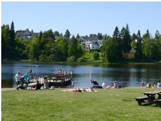
STYR UNNA: Kommunen fraråder folk å abde i Langvannet (bildet) og Vesletjern.